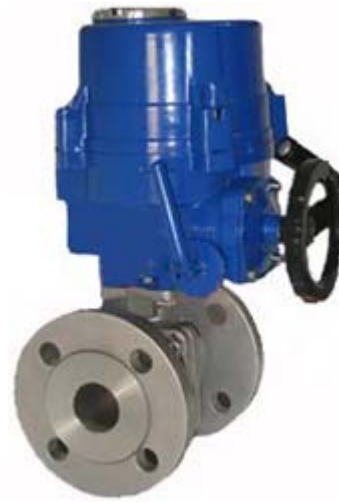
ZAJQ 电动调节球阀 (HQ 执行器)