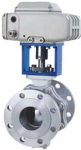
ZAJQ 电动调节球阀 (HR 执行器)

本公司生产的 ZAJQ 电动调节球阀适用于两位切断、调节的场合。球阀与执行机构的连接采用直连方式，电动执行机构内置伺服系统，无须另配伺服放大器，输入 4-20mA 信号及 220VAC 电源即可控制运转。电动调节球阀具有连线简单，结构紧凑、尺寸小、重量轻、阻力小、动作稳定可靠等优点。电动调节球阀通常用于密封要求严格的场合，除控制气体、液体、蒸汽介质外，还适宜控制污水和含有纤维性杂质的介质，广泛用于石油、化工、冶金、轻工、造纸、电站、制冷等工作领域。电动调节球阀是一种重要的阀类，在石油化工、长输管线等领域有广泛应用。球阀的关闭件是一个带孔的球体（或部分球），球体随阀杆转动，实现阀门的开启或关闭。电动调节球阀旋转 90°即可全关全开，与相同规格的闸阀、截止阀比较、球阀体积小、重量轻，便于管道安装。